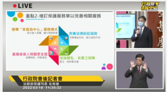
2022年3月10日行政院會後記者會 (第3793次會議)

以完善相關服務；四、明定法律訴訟之相關協助機制；五、強化犯罪被害人之人身安全保障；六、規範修復式司法之基本原則；七、通盤調整犯罪被害補償金之制度與性質；八、保護機構邁向專業化及透明化。