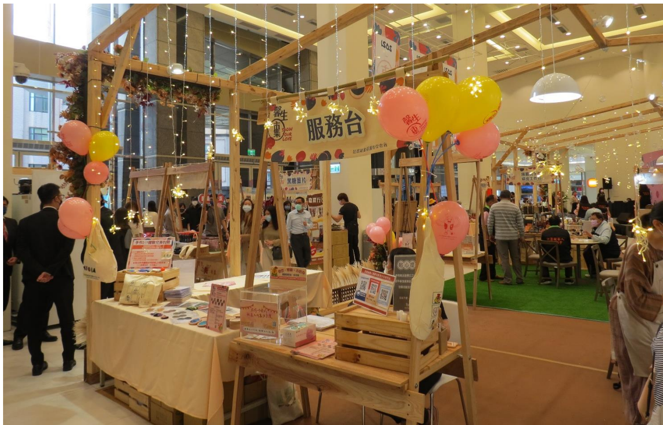
↑ 於 110 年 11 月 18-22 日放置在《2021 醫生公益市集》活動服務台