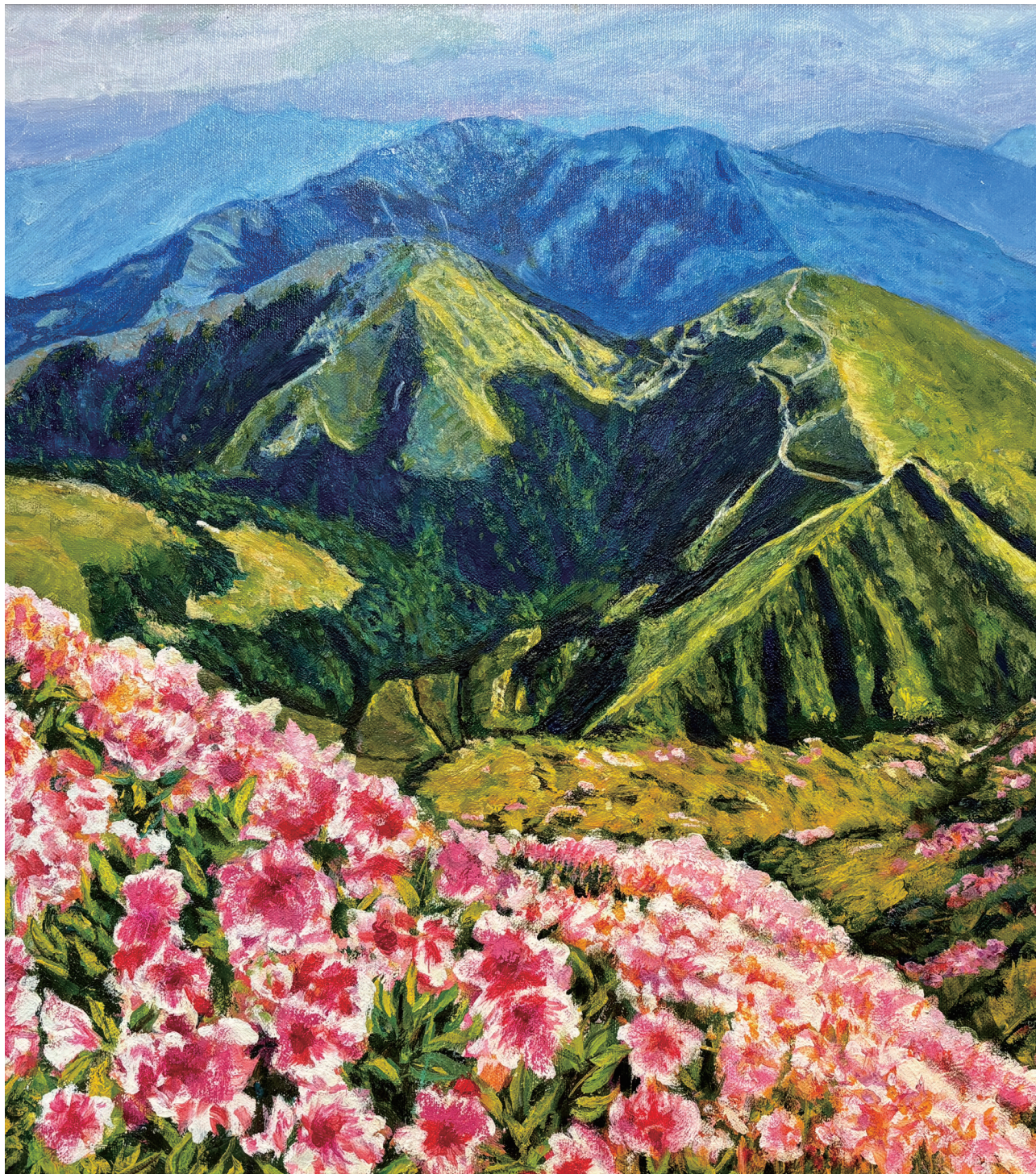
圖 / 士林分會 保護志工林美香《靜雅幽香》

犯保法新法元年 觀摩活動專刊 從馨出發·即時守護 六分會+地檢合辦觀摩活動 走入另一個家庭的生命故事